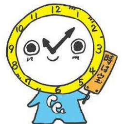
直江津南小キャラクター “時宝（ジッポー）”